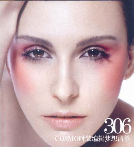
306 COSMO时装编辑梦想清单