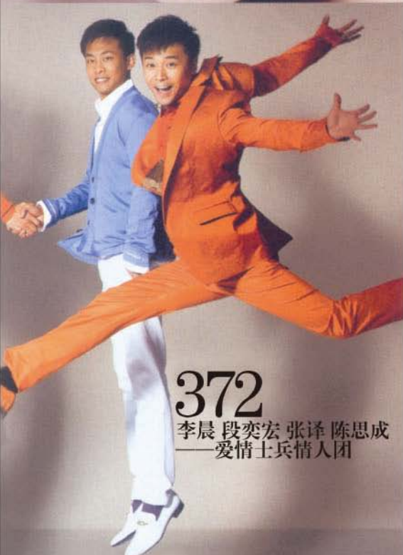
372 李晨 段奕宏 张译 陈思成 ——爱情士兵情人团